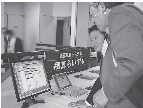
ロビーで行われた日立システムズの展示PR