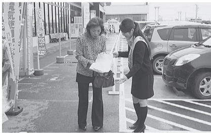
●久慈支部 8月1日(木) ユニバース久慈SC店で、リーフレット、うちわ等を配布し電気使用安全に関する啓蒙をした。