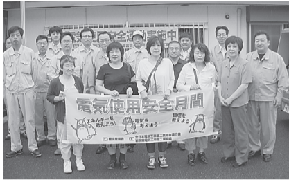
●宮古支部 8月1日(木) マリコブDORA、宮古市魚菜市場で、チラシ、ポケットティッシュ等を配布、電気使用安全を呼びかけた。