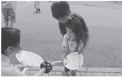
●二戸支部 8月1日(木) 二戸ショッピングセンターニコアでリーフレット、うちわ、花火を配布、電気事故防止、節電などを呼びかけた。