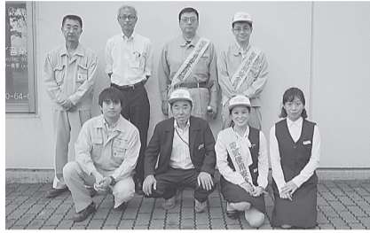
●水沢支部 8月1日(木) 水沢メイプル前で、ティッシュ、リーフレット、うちわ等を配布し、漏電遮断器取付や各種相談のPR。