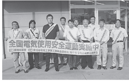
●花巻支部 8月2日(金) アルテマルカン桜台店でリーフレットを配布し電気的安全使用と節電について啓蒙。