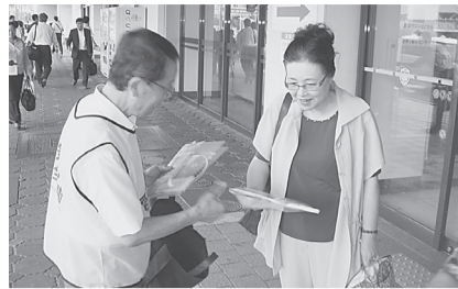
●盛岡支部 8月1日(木) JR盛岡駅前「滝の広場」でPRチラシ、うちわ、花火等を配布し電気的安全使用を啓蒙。