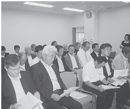
東北電力(株)研究開発センター