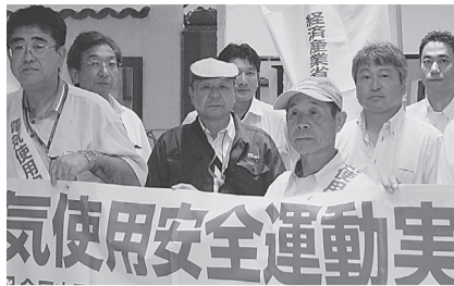
●北上支部 7月27日(土) イオン パルショッピングセンターでチラシ、花火、うちわ等を配布し安全な電気使用を呼びかけた。