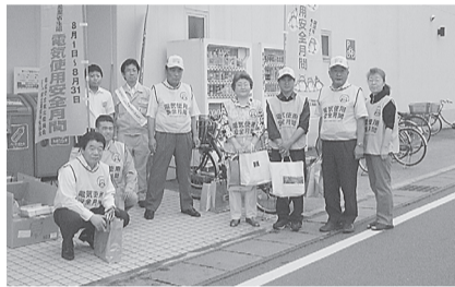
●一関支部 8月1日(木) コープ一関コルザで、たこ足配線防止、こまめにコンセント掃除、省エネ商品説明と使用方法などを呼びかけた。