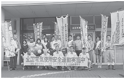
●釜石支部 8月1日(木) ジョイス釜石店、マストショッピングセンター(大槌町)にのぼりを立てリーフレットを配布、電気的安全使用と節電を呼びかけた。