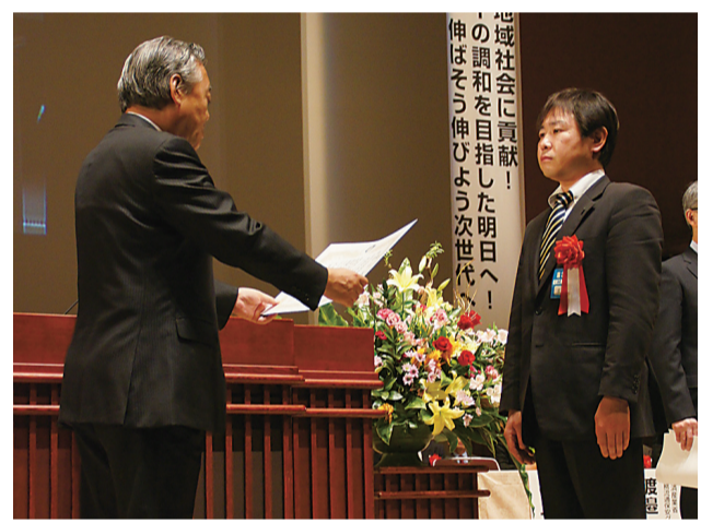
表彰状を受け取る川崎青年部長