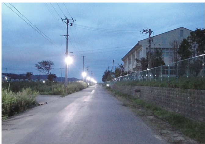
宮古工業高校防犯灯設置

日日電工連でも国に対して要望しているが、国では「安全性の確保」の観点から難色を示しているとのことで、実現までには相当の時間を要するとしている。 本県としては単なる期間短縮ではなく「安全確保に係る研修・実技」に係る講習等を実施し受講した者を対象とする旨の対案を提示し要望している。