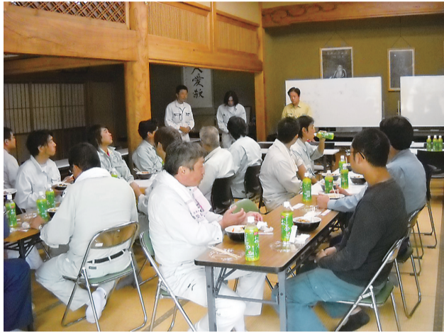
一休みで昼食 (本増寺境内・大船渡市内)

また、本事業の実 施について、甲論乙 駁はあったものの、 最後は一致団結して 防犯灯設置及び奇跡 の一本松のライトア ップを行うこととす るなど意思統一を図 ることができ、組織 の存在意義の再確認 と強化に繋げること ができた。