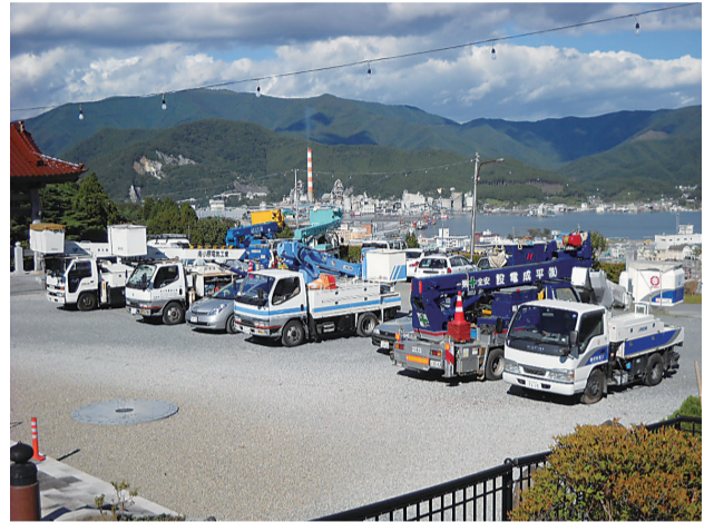
防犯灯設置のため各社から作業車が集結 (本増寺境内・大船渡市内)