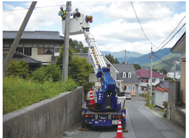
施工風景 (大船渡中学校通学路)