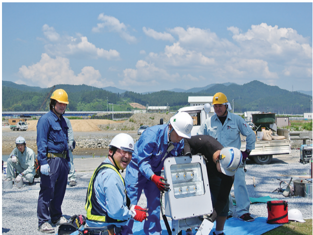
一本松の照明工事を施工中 (高田松原)