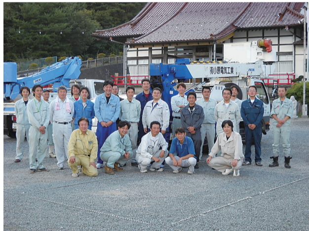
無事、施工が終了し集合 (本増寺境内・大船渡市内)