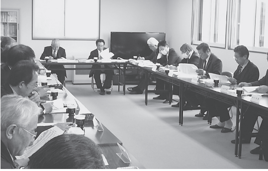
去る2月25日、平成26年度事業計画(案)と平成25年度決算見込み審議のため、組合役員・支部長合同会議と合わせ、政治連盟の評議員会が開催された。