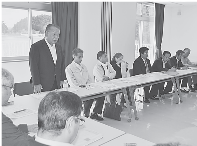
宮古地区での地域懇談会

建設業振興担当課長らが出席し、平成27・28年度県管建設工事競争入札参加資格審査基準の見直しについてや地域維持型契約方式について及び今年度の建設業支援事業について説明。その後、各地域の建設関連団体の代表者と各業界や各地域における問題点や要望について懇談が行われた。特に今年度、県は来年度以降の4年間（平成27～30年度）を、いわて建設業対策中期プランにおける復興基本計画8年間の後半4年間に当たり、本格復興期から復興後の更なる展開へ移行するまでの期間で、建設投資額の縮小が見込まれるため、経営環境の変化に対応するプランの策定年度と捉えており、平成27・28年度県管建設工事