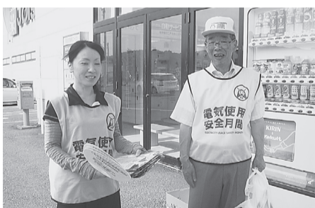
二戸支部 8月1日(金) 二戸ショッピングセンターニコア リーフレット、チラシ、うちわ、花火を配布し、電気使用安全月間のPR活動をした。