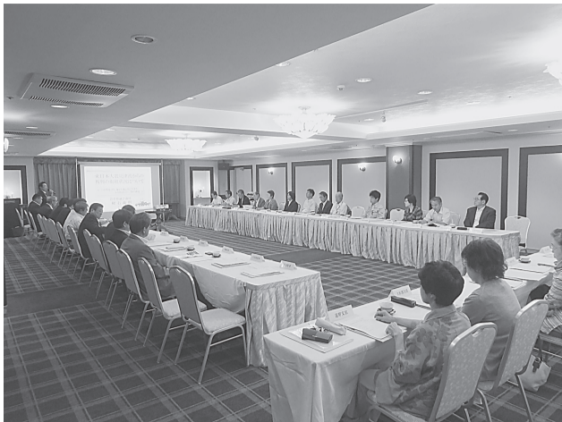
役員・支部長、事務職員合同会議

8月8日、ホテル東日本において、組合、組合政治連盟共催で、役員・支部長（評議員）事務職員合同会議が開催された。 はじめに、政治連盟主催で軽石県議から「東日本大震災復興の現状と今後の展望」と題し復興の現状と問題点等及び岩手県の対応状況などについて講演、また、特にも組合本部では第一種電気工事士の実務経験期間5年を3年への短縮に関する国に對し要望しているが、軽石議員にも支援を要請、これを