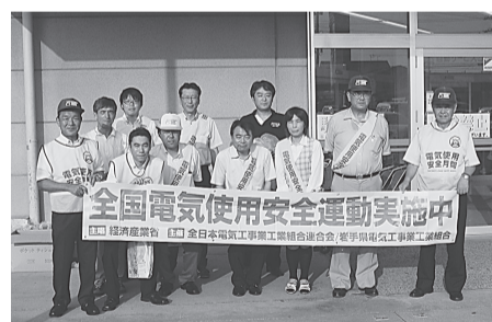
花巻支部 8月1日(金) アルテマルカン桜台店 電気使用安全月間のリーフレットに、ティッシュ、花火、うちわ等をセットにして配布。