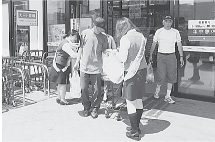
久慈支部 8月4日(月) ユニバース久慈ショッピングセンター リーフレット、うちわ等を配布し、節電、電気使用安全を呼びかけた。