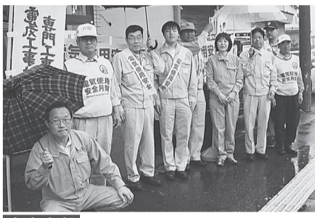
宮古支部 8月1日(金) 岩泉町太田地区チラシ、ティッシュを配布しながら、「電気工事は組合加入の登録(届出)標識のある工事店で!」「8月は電気使用安全月間」を呼びかけた。