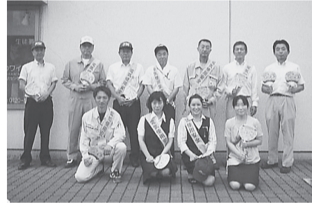
水沢支部 8月1日(金) 水沢メイプル前うちわ、ティッシュ、リーフレット等を歩行者等に配りながら節電と電気使用の安全を呼びかけた。