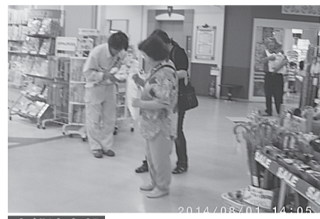
大船渡支部 8月1日(金) 南三陸ショッピングセンターサン・リア リーフレット、ティッシュ、うちわ等を配布し、電気の使用安全、節電や省エネについて呼びかけた。