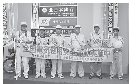
釜石支部 8月1日(金) ジョイス釜石店、マストショッピングセンターのぼりを立て、リーフレットやうちわ等を配りながら、電気の使用安全と節電の協力を呼びかけた。