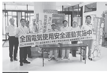
北上支部 7月26日(土) パルショッピングセンター 電気事故防止を啓蒙、チラシ、うちわ、ボックスティッシュ、花火等を袋に入れ、手渡した。