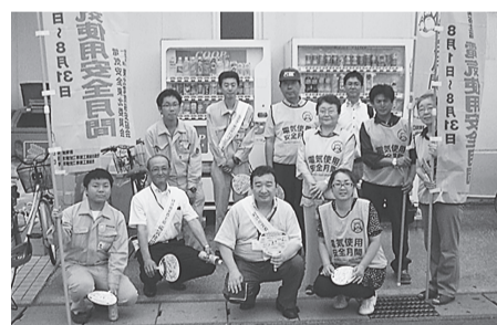
一関支部 8月1日(金) コーポ一関コルザ 正しい電気使用と省エネ利用、たこ足配線防止を呼びかけるとともに、省エネ商品を説明した。