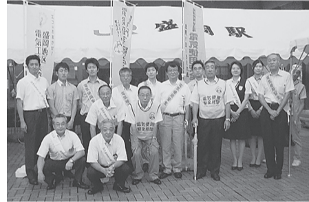
盛岡支部 8月1日(金) JR盛岡駅前「滝の広場」チラシ、うちわ、花火セット等を配布し、電気を安全に使用するよう呼びかけた。