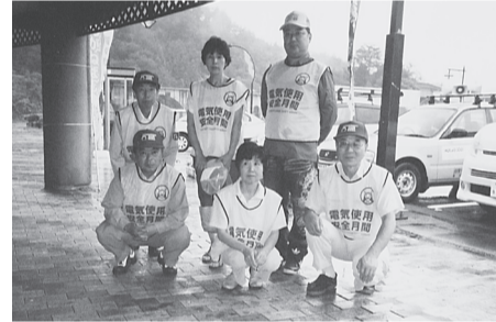
遠野支部 8月21日(木) 遠野市内(宮守方面) 車載スピーカーにより、電気工作物の保安確保と災害防止節電推進を呼びかけた。