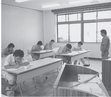
釜石支部で開催の講習会

こうした状況を踏まえ組合本部としては、重要なライフラインの一つである電気工事業を継続的に適切に維持していくためには、後継者の育成・確保が必要であると認識し、特に第一種電気工事士の育成を行うこととして、過般、育成に関する実施要領素案を役員等に提示していた。