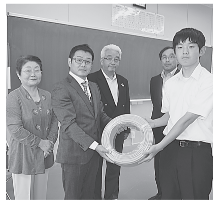
〈一関支部〉 7月3日(金) 一関工業高校へ