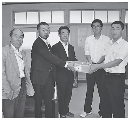
〈奥州支部〉〈水沢支部〉 7月2日(木) 水沢工業高校へ