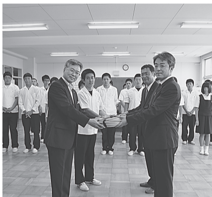
〈花巻支部〉〈北上支部〉 7月2日(木) 黒沢尻工業高校へ