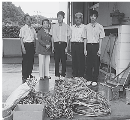
〈一関支部〉 7月3日(金) 千厩高校へ