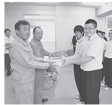
〈大船渡支部〉 7月9日(木) 大船渡東高校へ