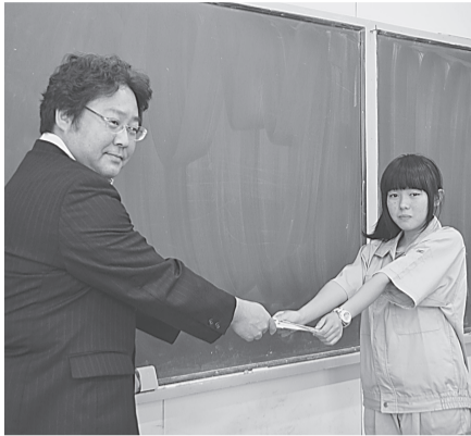
〈盛岡支部〉 7月6日(月) 盛岡工業高校へ