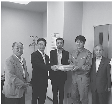
〈奥州支部〉〈水沢支部〉 7月8日(水) 産業技術短期大学校水沢校へ