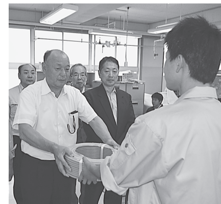
〈久慈支部〉〈二戸支部〉 7月2日(木) 福岡工業高校へ