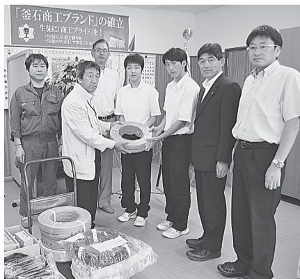
〈遠野支部〉〈釜石支部〉 7月10日(金) 釜石商工高校へ