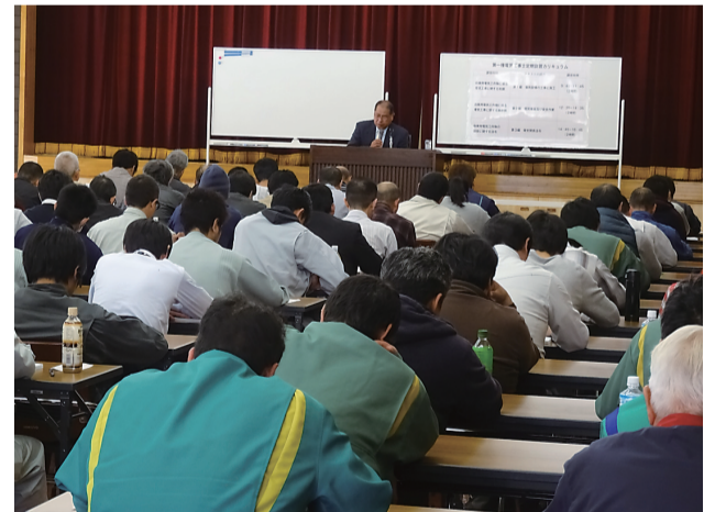
県内外から多くの受講生が参加