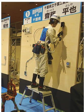
ものづくりコンテスト等で優秀な実力者が出場

もの。また、変更になったことを知らない資格者も多数いると考えられる。そのため、組合では、第一種電気工事士免許をお持ちの皆さんに電気工事技術講習センターへの登録を呼びかけている。