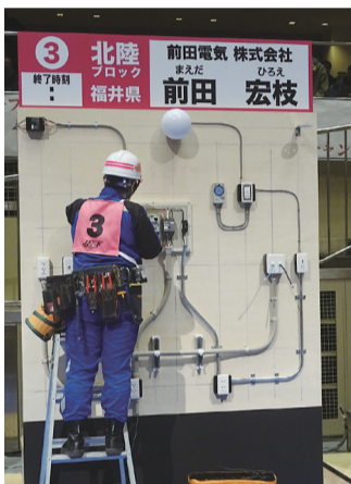
各地区ブロック推せん選手として出場

後での訓練は、大きな負担であったようである。訓練に要する材料経費の負担という声もあった。