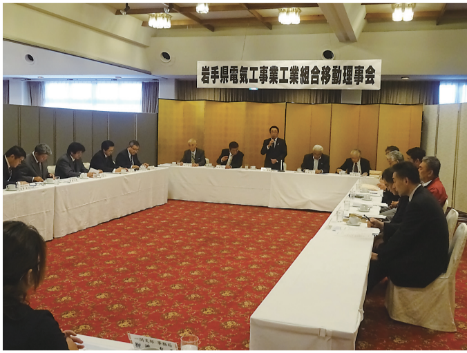
岩手県電気工業工業組合移動理事会

現状、本部から支部への手段としてサイボウズは一定程度利用されているが、各支部から組合員への情報伝達手段としてほとんど利用されず、ファクス利用が大部分を占めている状況が明らかにされたことから、今後、サイボウズの利用促進を図ることとした。