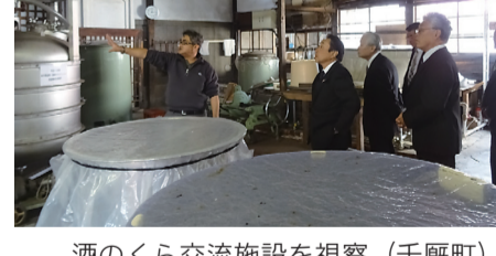
酒のくら交流施設を視察(千厩町)