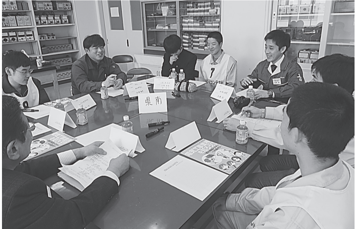
高校生と和やかに意見交換する組合青年部