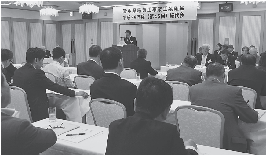
岩手県電気工事業工業組合 平成29年度(第45回)総代会