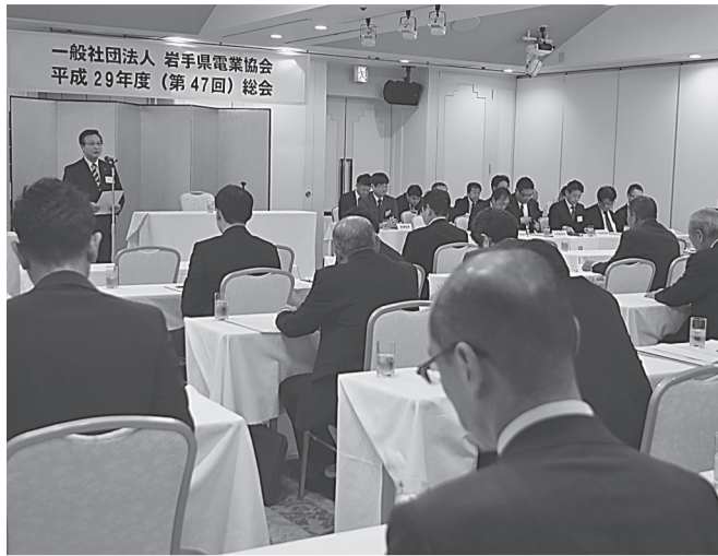
一般社団法人 岩手県電業協会 平成29年度(第47回)総会