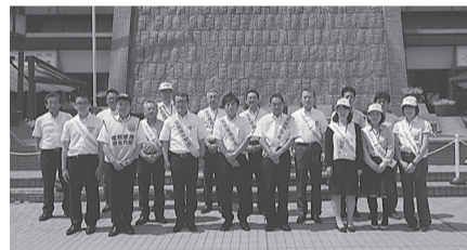
盛岡支部 8月1日(火) 盛岡駅前にて街頭広報活動