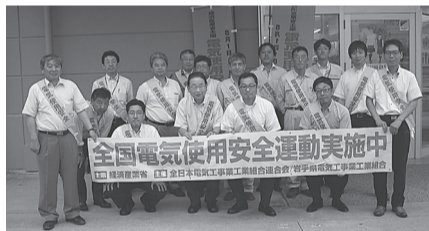
花巻支部 8月4日(金) アルテマルカン桜台店でリーフレット等配布