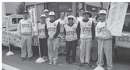
宮古支部 8月1日(火) 岩泉町内にてリーフレット等配布