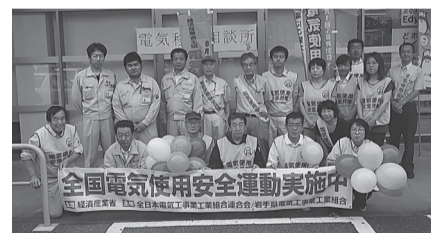
釜石支部 8月1日(火) マイヤ釜石店等でリーフレット等配布