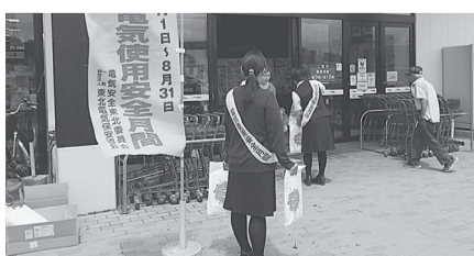
久慈支部 8月1日(火) ユニバース久慈店でリーフレット等配布