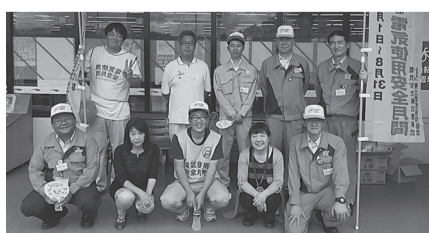
二戸支部 8月1日(火) ユニバース堀野店で街頭広報活動