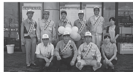
水沢支部 8月1日(火) コープアテルイ前で電気の安全使用と節電をPR