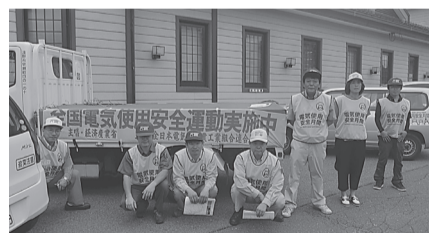
遠野支部 8月17日(木) 電気安全使用を車載スピーカーで呼びかけ