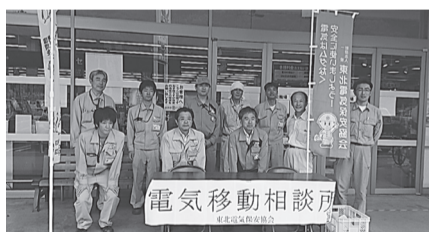
大船渡支部 8月1日(火) マイヤ大船渡インター店で節電や省エネをPR