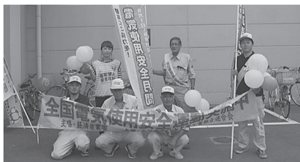
釜石支部(大槌) 8月1日(火) マストショッピングセンター前でリーフレット等配布