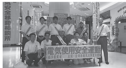
北上支部 7月29日(土) イオン江釣子店で組合加入工事店の案内チラシ配布