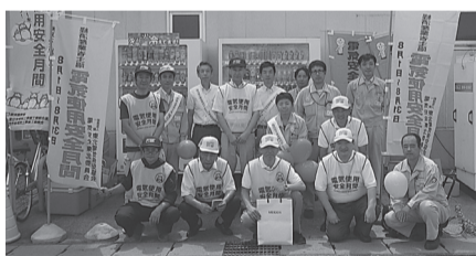
一関支部 8月1日(火) コープ一関コルザで街頭広報活動