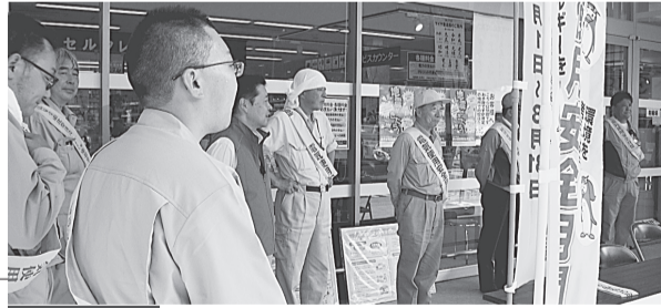
大船渡支部 8月1日(木) マイヤ大船渡インター店 正面入り口2ヶ所 東北電力大船渡電力センター、(一財)東北電気保安協会大船渡事業所と合同でリーフレット、ポケットティッシュ、うちわ等を配布し、電気使用、節電や省エネについて呼びかけをした。