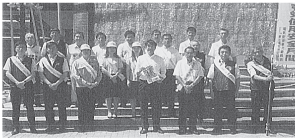
盛岡支部 8月1日(木) 盛岡市JR盛岡駅前「滝の広場」街頭広報活動・電気使用安全PR用グッズ類を配布した。