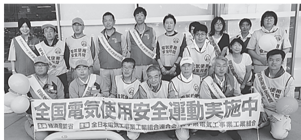
釜石支部 8月1日(木) マイヤ釜石店、シーサイドタウンマスト(大槌町) リーフレット等を配布しながら、電気の安全使用を呼びかけた。