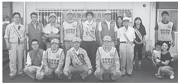
宮古支部 8月2日(金) マリンコープDORA、協同組合宮古市魚菜市場 チラシ・PRリーフレット・ポケットティッシュ・うちわを配布して電気の安全使用に関する啓発を行った。