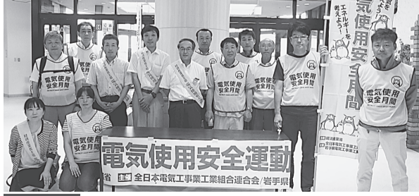
北上支部 7月27日(土) イオン江釣子店、江釣子SC 出入口2ヶ所 市役所、各庁舎へのポスター掲示依頼。組合加工事店の案内チラシ配布した。