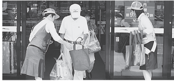
久慈支部 8月1日(木) ユニバース久慈SC店 出入口リーフレット・うちわ等を配布し節電、電気使用安全を呼びかけた。