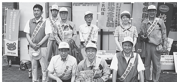
水沢支部 8月1日(木) いわて生協コープアテルイ前～サンデー水沢店前 リーフレット等を配布しながら、夏場の電気の安全な使用をPRした。