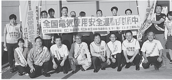
花巻支部 8月2日(金) アルテマルカン桜台店 電気使用安全月間のリーフレットに、うちわ等をセットにして配布。一般需要家に安全月間の内容について周知した。