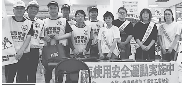
遠野支部 8月22日(木) 遠野ショッピングセンターとびあ 東北電力遠野電力センターの協力を得て、リーフレット、エコバック、ティッシュ等を配布し、電気使用安全、節電についてのPRを実施した。