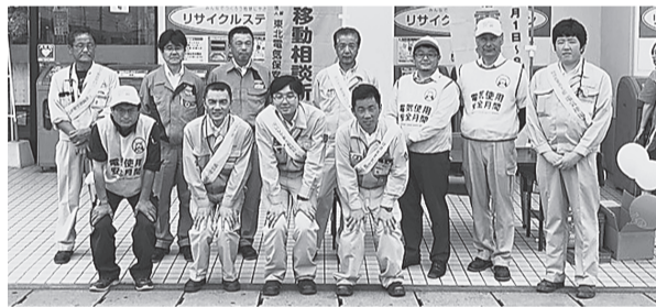
一関支部 8月1日(木) いわて生協コープ一関コルザ出入口付近 街頭広報活動を実施。夏場の電気の安全使用をPRした。