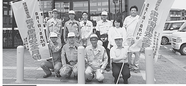
二戸支部 8月1日(木) ユニバース堀野店 東北電力二戸電力センター、(一財)東北電気保安協会二戸事業所と一緒にPRリーフレット、うちわ等を配布しながら電気の使用安全及び節電を呼びかけた。