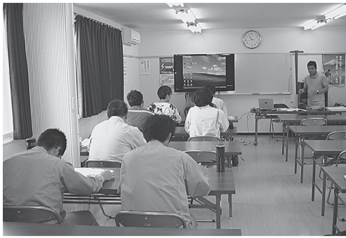
花巻支部で開催の講習会