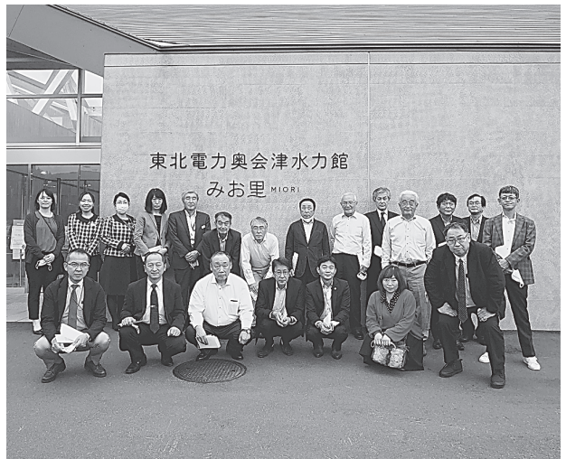
東北電力奥会津水力館 みおり MIORI

組合主催東北電力 関連施設視察研修事 業として、10月15日 (金)、16日(土)の両日、 平野理事長はじめ理 事等18名が福島県会