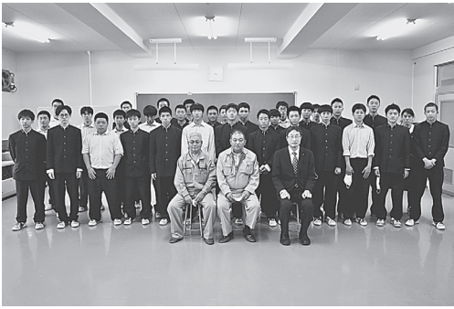
〈大船渡支部〉10月15日(金)大船渡東高校

今年度で13回目を迎えた県内工業系高校等に対する支援事業は、協会・組合共同事業として各支部において実施。大船渡支部では大船渡東高校へ電線、工具等を贈呈。今年度も全支部において計11校に対し実習用資材の贈呈が行われた。