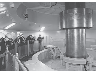
第二沼沢発電所 (施設内見学)