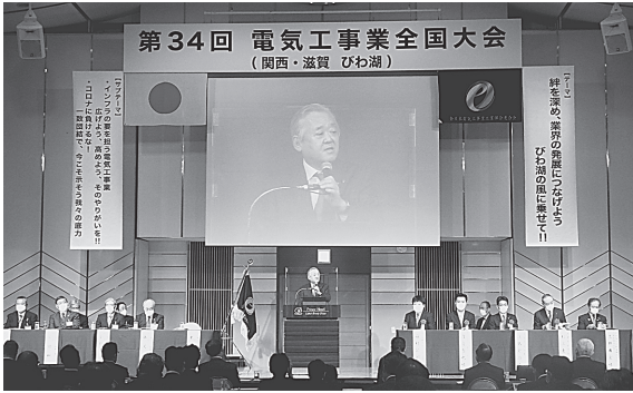
第34回電気工事業全国大会 (関西・滋賀 びわ湖)