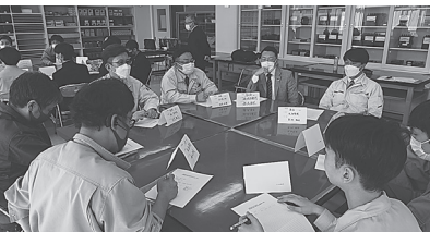
高校生との意見交換会