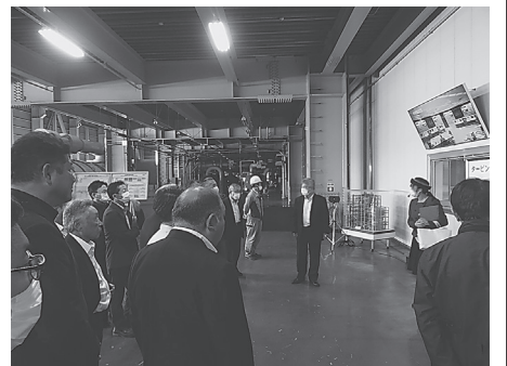
能代火力発電所内部

や能代風力発電所の風車を眺めることができた。また、PR施設の能代エナジAMPパークでは、蒸気タービンからの排熱を利用した熱帯植物園を見学した。その後、秋田市へ移動し、秋田洋上風力発電(株)のPR施設「AOW風みらい館」を見学。隣接するポイントタワーセリオンの展望室(地上100m)からは、秋田港に設置された13基の風車や秋田市内の景色を360度見渡すことができた。時刻はちょうど夕暮れ時、日本海に沈む夕日はまさに絶景でした。