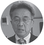
黒沢尻工業高校 八重樫電気科長