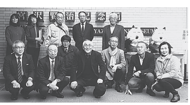
宮沢賢治記念館にて