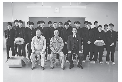
(大船渡支部) 11月13日(月)大船渡東高校